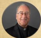
Most Rev. Myron J. Cotta Bishop of Stockton

Visit Office of Vocation at www.stocktondiocese.org/vocations vocations@stocktondiocese.org | (209) 546-7620